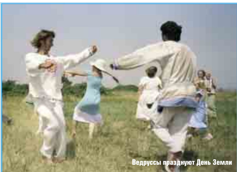
Ведрусы празднуют День Земли