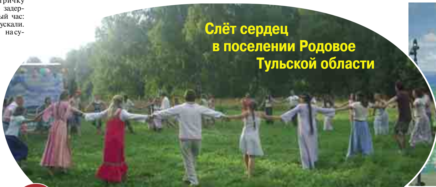
Слёт сердец в поселении Родовое Тульской области

Сейчас все уже разбегались по домам, поселениям. Эмоции улеглись. Из десятков прекрасных и светлых лиц зримо высветилось одно. Может быть, это он?..